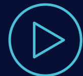
TV en directo