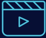
Películas y vídeos