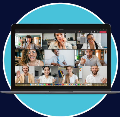
Inicie la reunión desde su ordenador portátil