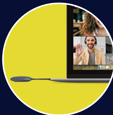
Conecte CleverCast a su ordenador portátil