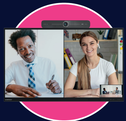
Colabora a tu manera